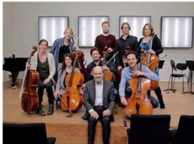
Arvo Pärt poseert met het Cello Octet Amsterdam.

deze wereld die toch wel worstelt met zichzelf. Er zit ook veel maatschappijkritiek in. Ze maakt je ervan bewust dat er meer is in het leven dan alleen de waan van de dag, dat er ook zo iets is als schoon-