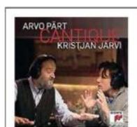
Een van de vele cd's van Pärt.